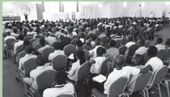
日本留学フェアの会場のルワンダ大学には約1,000名の参加があった。

2018年2月首都キガリにて開催(写真参照) 日本からの参加大学数：7(現地参加：2、オンライン：5) フェア参加者：約1,000名