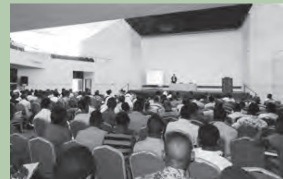
日本留学フェアはダルエスサラーム大学で開催され、国内の大学生や教職員に加え、ダルエスサラーム市内の高校生らの参加もあった。

2016年2月ダルエスサラームで開催(写真参照) 日本からの参加大学数：4 フェア参加者：約350名