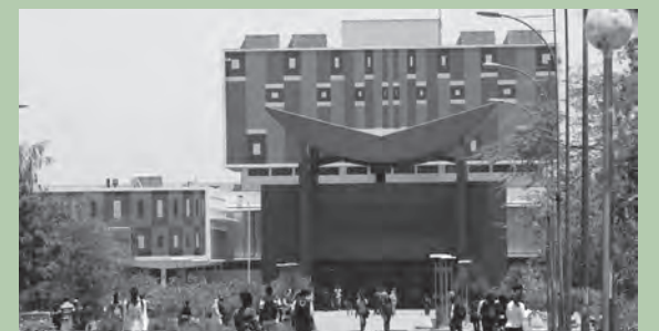
ダカール大学（Université Cheikh Anta Diop de Dakar:UCAD）