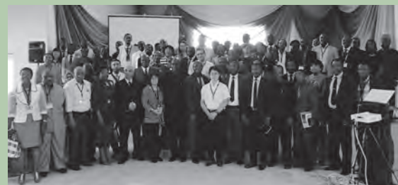
2017年9月ナイジェリア南部のエド州ベニンシティで開催されたシンポジウムで「日本留学海外拠点連携推進事業」の活動をナイジェリアの大学関係者に紹介。

*これまでサブサハラ・アフリカからの日本への留学生数は長らくケニアがトップを保ってきたが、日本語学校への留学生を含めた場合は、2019年はナイジェリアがケニアを抜いている。ナイジェリアの特徴として、国費(MEXT)やJICA奨学金以外の留学生が増加しており、また(1年以内)短期留学生や日本語学校への留学生も多い。