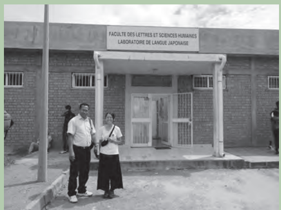
2019年 アンタナナリボ大学日本語研究所(2015年 草の根文化無償により建設)の前で現地の日本語教育を担うマダガスカル人教師とJICA 青年海外協力隊員

2020年9月に現地開催を予定していたが、新型コロナウイルス感染症拡大の影響で中止。代替案として、同年9月オンラインにて開催。参加者760名。