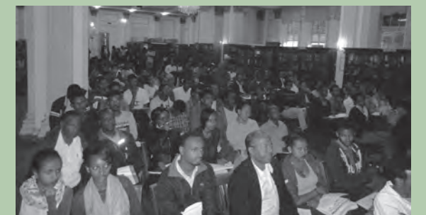
2017年フェア会場となったラス・マコンネン・ホール（2019年草の根文化無償により修復工事完了）

2017年9月アディスアベバ大学で開催（写真参照） 日本からの参加大学数：7 フェア参加者：約300名