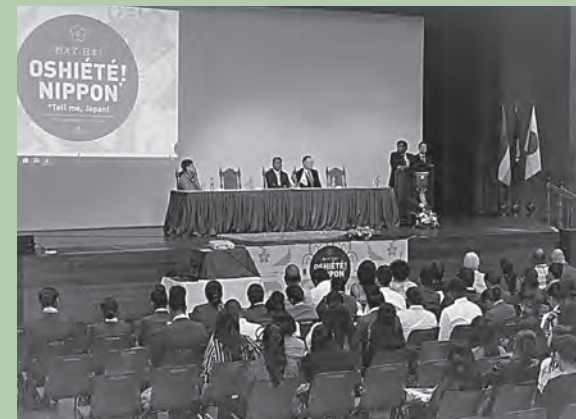
2019年9月モーリシャス大学で開催されたイベント「教えて、日本！」

*2020年2月に在モーリシャス日本大使館が現地の大学(African Leadership University:ALU)と協力し、日本留学経験者が体験談を語るイベントを実施。